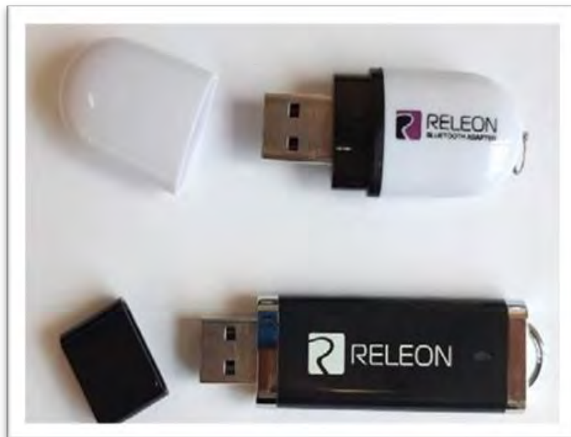
Рис. 13. Общий вид USB-флеш-накопителя (внизу) и Bluetooth-адаптера (вверху) Releon

Lite на регистратор данных с операционной системой Windows может осуществляться как с USB-флеш-накопителя, так и с сайта производителя, установка на мобильные телефоны (смартфоны) — только с сайта производителя, ссылка на который приводится в списке источников информации пособия. В на устройства с платформами Android и iOS . Порядок установки ПО Releon Lite описан в руководстве, которое входит в комплект поставки. Алгоритм работы в программном обеспечении несложен. Графически он представлен на следующей схеме (рис.14)