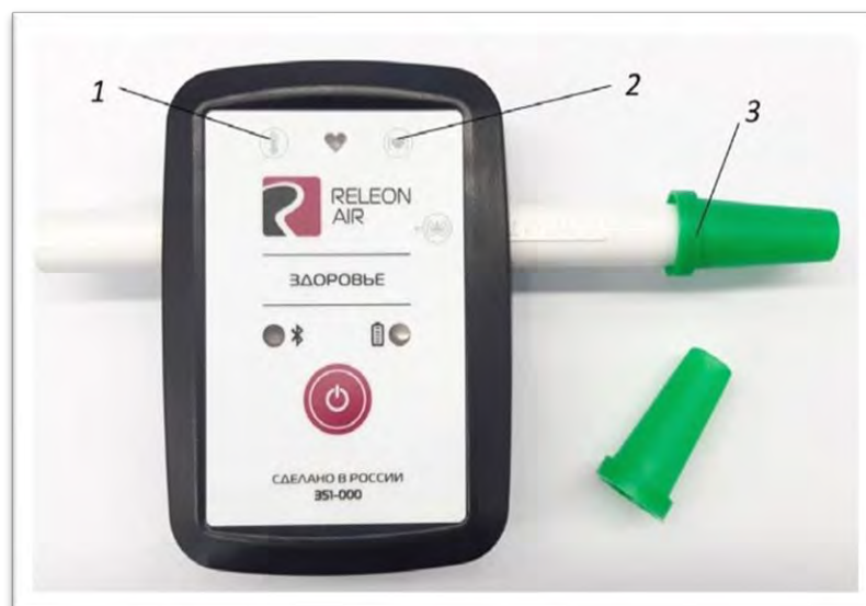
Рис. 3. Мультидатчик по физиологии. Обозначение разъёмов и технологических отверстий: 1 — температура тела, 2 — пульс, 3 — частота дыхания (надет съёмный мундштук)