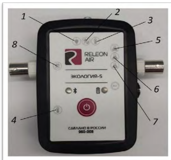
Рис. 2. Мультидатчик по экологии. Обозначение разъёмов и технологических отверстий: 1 — освещённость, 2 — относительная влажность воздуха, 3 — температура окружающей среды, 4 — температура растворов, 5 — нитрат-ионы, 6 — хлорид-ионы, 7 — pH, 8 — электропроводность.

Мультидатчик по экологии позволяет измерять следующие показатели: водородный показатель водных сред, концентрации нитрат-ионов и хлорид-ионов, электропроводность, влажность, освещённость, температуру окружающей среды, температуру растворов, растворов и твёрдых тел ( рис. 2 ).