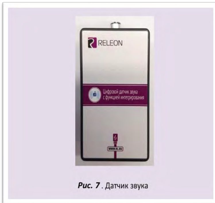
Рис. 7. Датчик звука

Датчик звука — измеряет уровень шумов в окружающей среде и при оценке шумопоглощающих изоляторов. Динамический диапазон: от 30 до 130 дБ. Частотный диапазон: от 50 Гц до 8 кГц. Разрешение: 0,1 дБА (акустические децибелы). Технологические особенности: датчик чувствителен к резким звукам, которые могут дать завышенные результаты измерений.